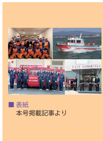
■ 表紙 本号掲載記事より